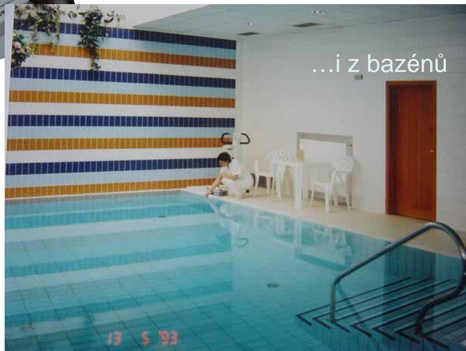
...i z bazénů