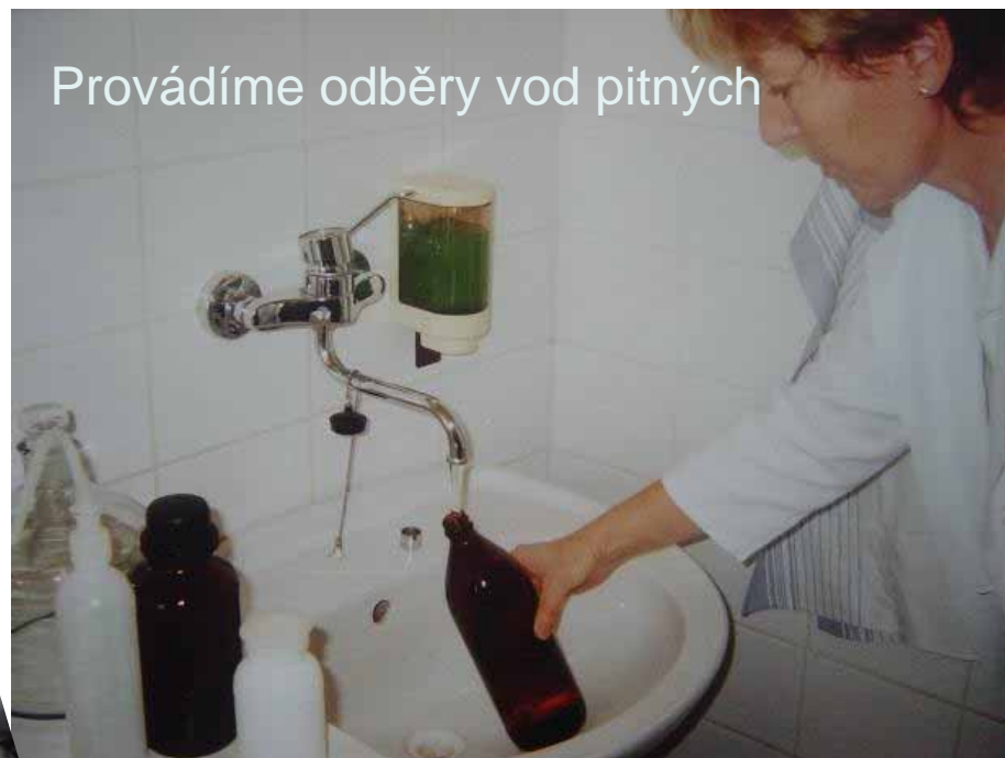
Provádíme odběry vod pitných