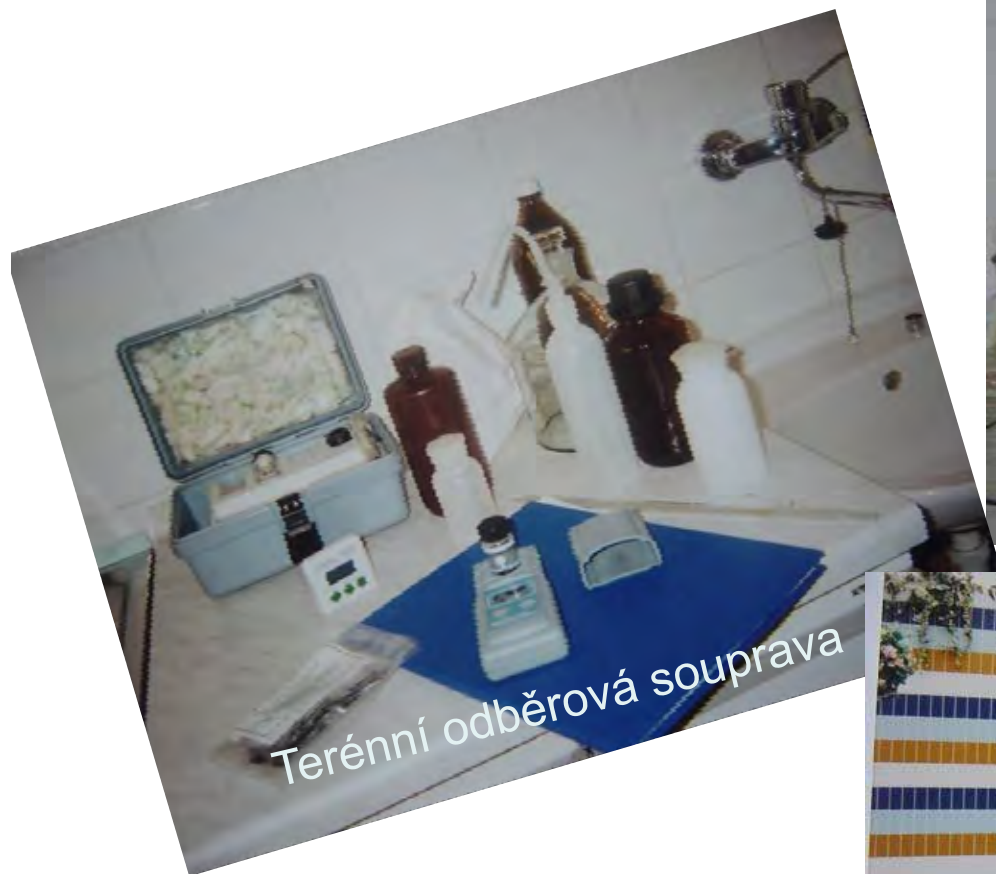
Terénní odběrová souprava