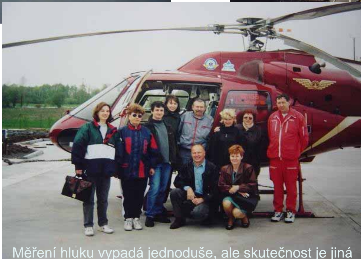
Měření hluku vypadá jednoduše, ale skutečnost je jiná