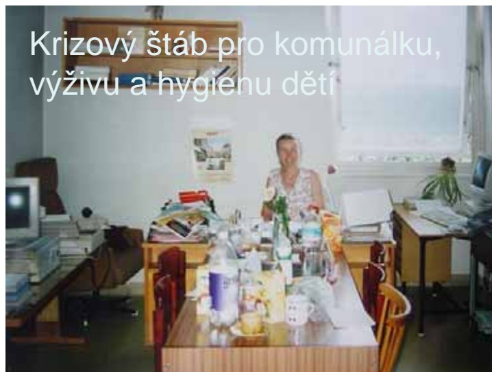
Krizový štáb pro komunálku, výživu a hygienu dětí