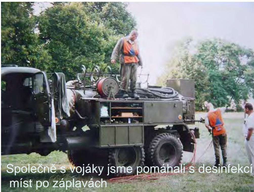
Společně s vojáky jsme pomáhali s desinfekcí míst po záplavách