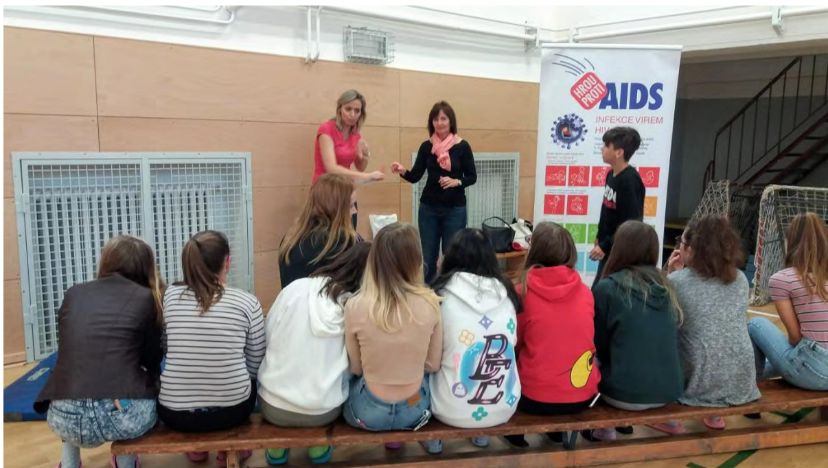
Pracovníci Krajské hygienické stanice Moravskoslezského kraje realizují projekt Hrou proti AIDS.