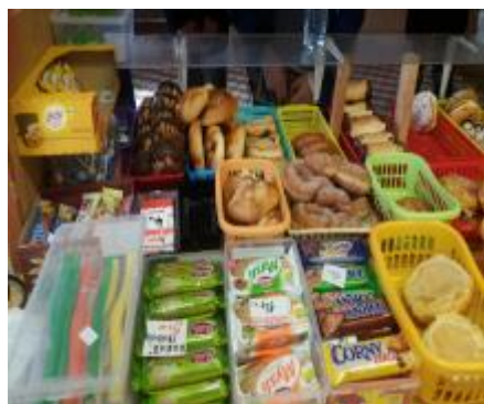
obr. č.1, 2 Nevhodný sortiment