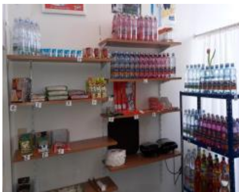
obr. č. 3, 4 Omezený sortiment