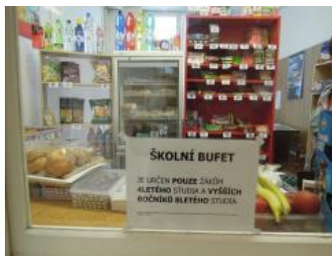
obr. č. 5 Označení kantýny