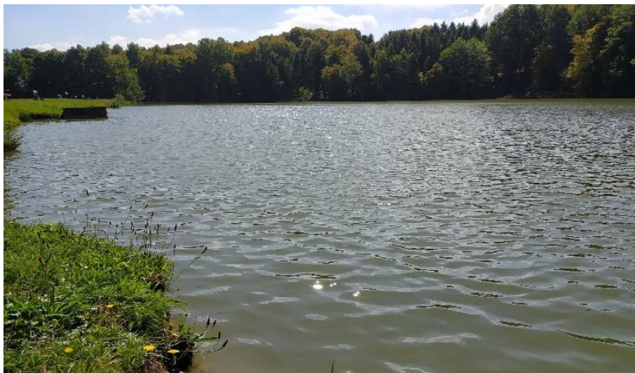
Koupací místo Rybník pod Hradem

V oblasti Osoblažska bude monitorována kvalita vody v Rybníku Pod Hradem v obci Bohušov. Jedná se o koupací oblast s kvalitou vody, hodnocenou jako vhodnou ke koupání s mírně zhoršenými vlastnostmi. V loňském roce od začátku srpna byla hodnocena kvalita vody jako zhoršená jakost vody, kdy lze očekávat lehké zdravotní obtíže. Byl zaznamenán výskyt sinic r. Planktothrix v hojném množství.