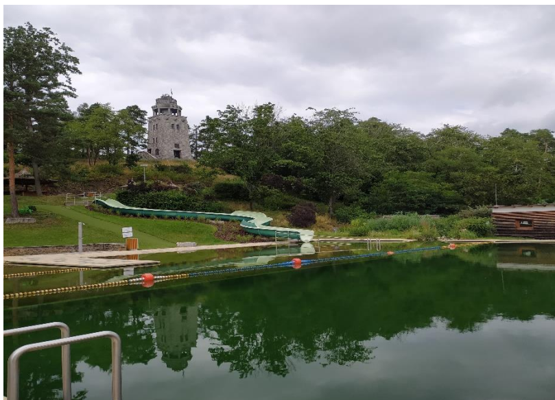
Přírodní koupací Biotop Úvalno

Příznivci koupání v přírodních koupalištích mohou navštívit Plovárnu Na Výsluní v obci Úvalno , která je v provozu od r. 2018, provoz zde bývá každoročně zahájen v měsíci červnu. Jedná se o přírodní koupací biotop, který byl vybudován v prostorách původního obecního koupaliště. Biologická úprava vody je tvořena třemi lagunami gravitačně propojenými nastavitelnými otevřenými přepady, je osázena rostlinami do hydroponického substrátu. Provozovatel zajišťuje kontrolu kvality vody ke koupání v rozsahu přílohy č. 7, tabulky č. 2 vyhlášky č. 238/2011 Sb.