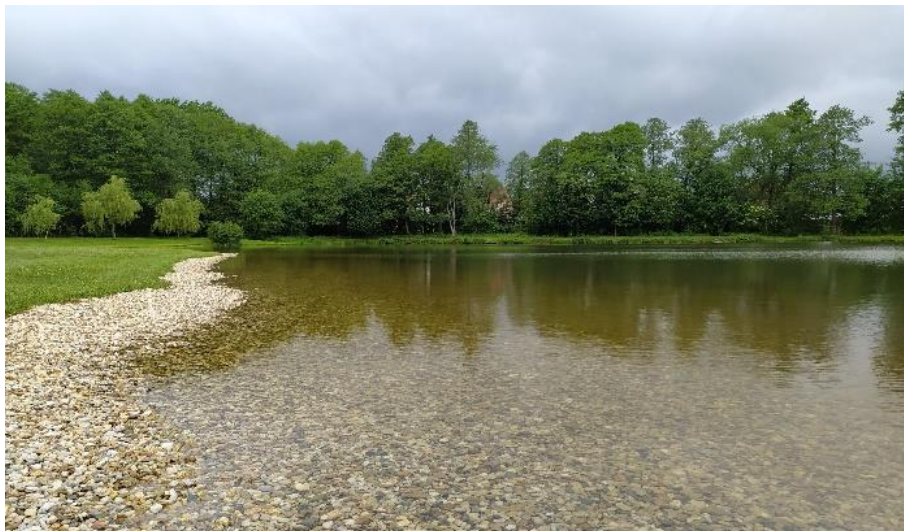
Rybník Edrovice

V oblasti Rýmařovska se nacházejí 2 koupací oblasti – rybník Tvrdkov a rybník Edrovice.