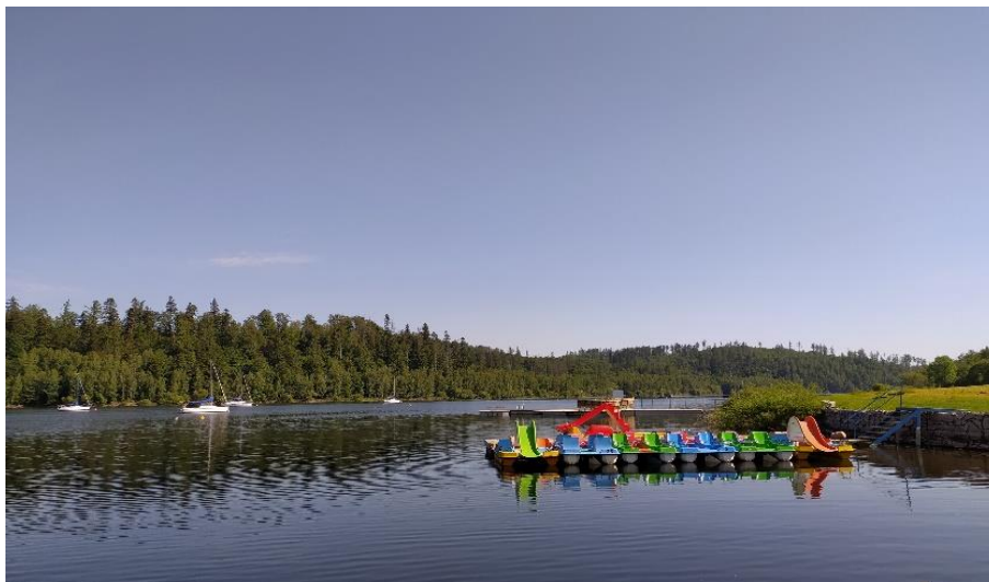
Koupačí místo Nová Pláň

Na vodní nádrži Slezská Harta jsou odběrná místa v obcích Nová Pláň, Roudno a Leskovec nad Moravicí . Jakost povrchové vody ke koupání v této vodní nádrži je klasifikována jako “výborná”. Návštěvníci mají k dispozici upravené pláže, hygienické zázemí, občerstvení, půjčovny lodí. Kromě rekreace se využívá vodní nádrž Slezská Harta také jako zdroj pitné vody a protipovodňová ochrana, nachází se v ochranném pásmu. Z toho důvodu se zde nesmí používat lodě se spalovacími motory. Výjimku dostala malá loď Santa Maria pro 10 návštěvníků. Od 1.5.2026 do 30.12.2026 bude v provozu také loď Harta o kapacitě 45 návštěvníků. Jde o unikátní vyhlídkovou loď s horní otevřenou palubou a plně ekologickým pohonem.