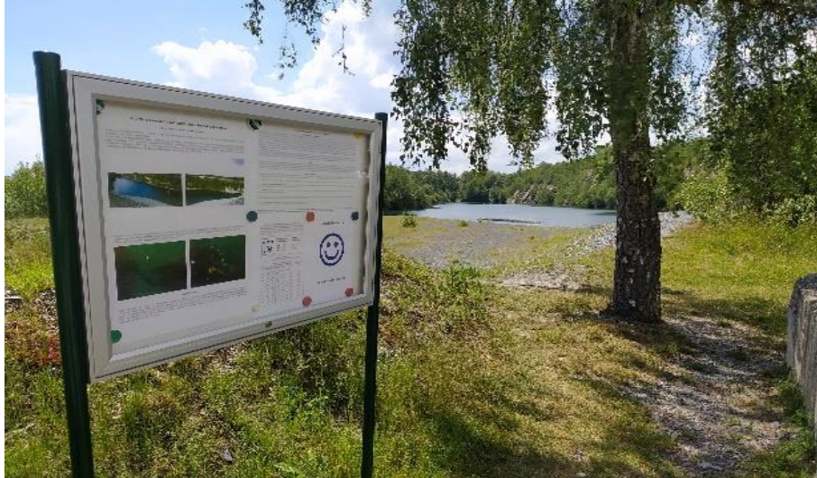
Informační tabule KHS MSK – Koupací místo lom Svobodné Heřmanice

Další koupací oblastí je lom Svobodné Heřmanice . Jde o břidlicový lom o délce cca 500 m, šířce 30-70 m a hloubce 36 m. Vzhledem ke své hloubce je kromě koupání využíván také k potápění. Lom Svobodné Heřmanice je zařazen jako místo odběru vzorků vody z povrchových vod ke koupání bez výskytu sinic. V rámci koupací sezóny budou prováděny odběry dle stanoveného monitorovacího kalendáře pouze k mikrobiologickému vyšetření v rozsahu přílohy č. 1 vyhlášky č. 238/2011 Sb., o stanovení hygienických požadavků na koupaliště, sauny a hygienické limity písku v pískovištích venkovních hracích ploch, ve znění pozdějších předpisů a budou prováděna vizuální stanovení na místě.