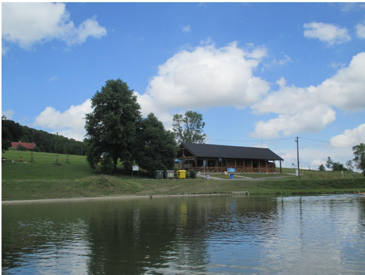
VN Čerták, okres Nový Jičín.

S výjimkou nádrže Brušperk, kde i nadále není vyloučeno riziko onemocnění cercáriovou dermatitidou, je voda na ostatních výše uvedených vodních plochách vhodná ke koupání.