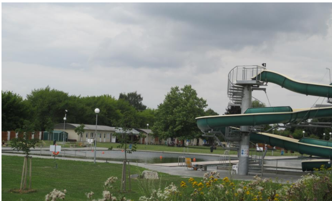
Přírodní koupací biotop ve Studénce, okres Nový Jičín.

V minulém týdnu zajistili ověření kvality vody provozovatelé koupaliště Na Hrázi v Darkovicích na Opavsku, nádrže v areálu Heipark v Tošovicích a přírodní koupací biotopu ve Studénce v okrese Nový Jičín. Kvalita vody na uvedených vodních plochách je vyhovující.