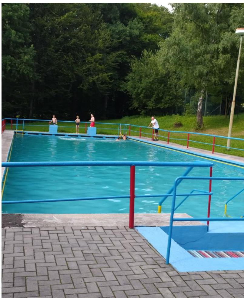
Nádrž ke koupání v areálu Krkoška, okres Frýdek - Místek.

V rámci dozorové činnosti KHS MSK byly v úterý 10.8.2021 odebrány vzorky vody ke koupání v přírodním koupališti Karvinské moře v Karviné, následující den pak kontrolovány nádrže ke koupání v okrese Frýdek – Místek: nádrž u chaty Dukla a v areálu Horského hotelu Lorkova vila (dříve Horský hotel Čeladenka) v Čeladné a velká a malá nádrž RA Krkoška v Kunčicích pod Ondřejníkem. K dispozici jsou výsledky z kontroly nádrží v areálu Wellness hotelu Bahenec na Frýdeckomístecku a jezera v areálu štěrkovny Hlučín, které byly provedeny v minulém týdnu. Laboratorní analýzy vzorků z frýdeckomísteckých nádrží ze středy nejsou ukončeny, v ostatních případech odebrané vzorky vyhovovaly hygienickým požadavkům na koupání v přírodě. Pondělní odběry z jezera štěrkovny Hlučín však již prokázaly zhoršení kvality vody (viz výše).