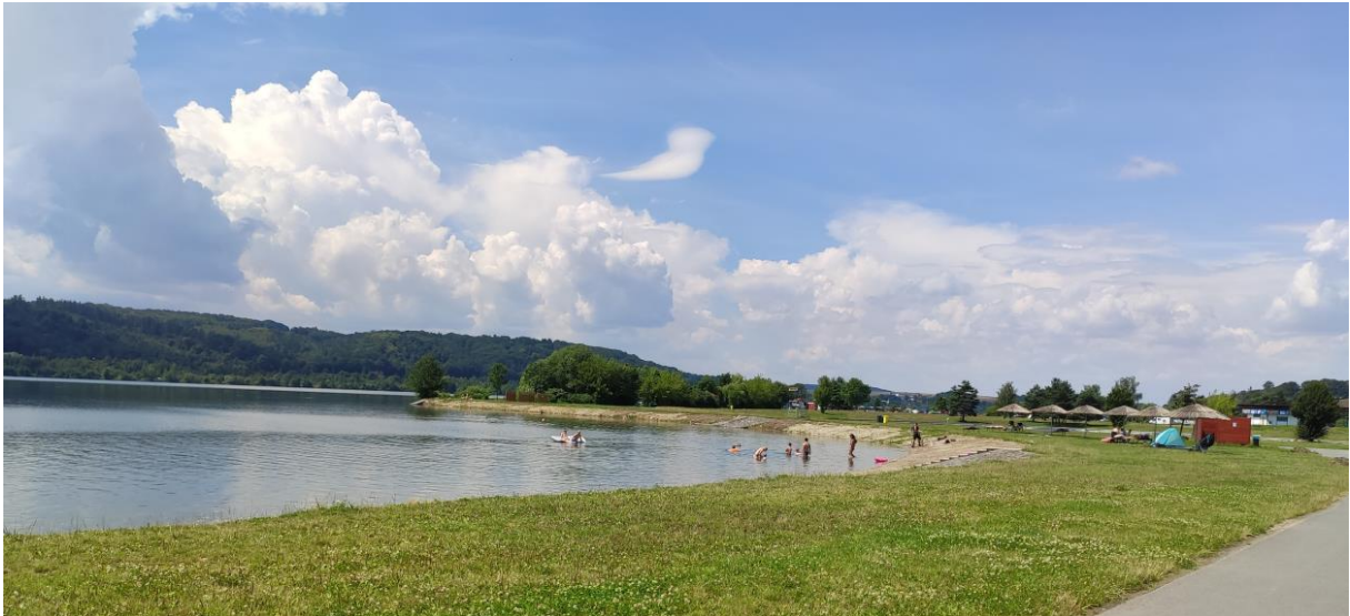
Štěrkovna Hlučín, okres Opava.

Mimořádně byly odebrány vzorky ke kontrole v jezeře štěrkovny Hlučín. Laboratorní analýzy prokázaly oproti minulému týdnu zlepšení kvality vody, koupání v jezeře již není nutné omezovat.