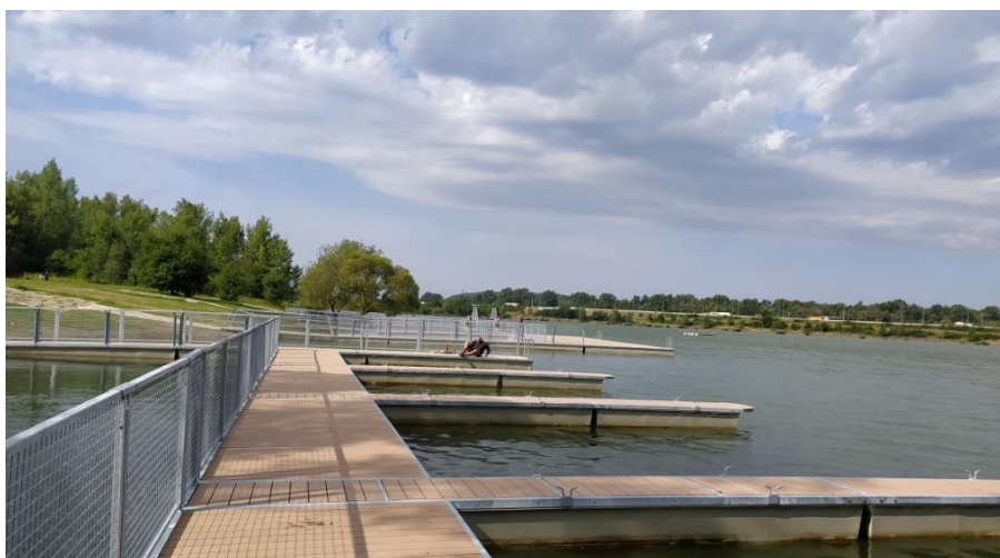
Vrbické jezero, okres Karviná.

Koupání v ostatních uvedených nádržích je bez zdravotních rizik.