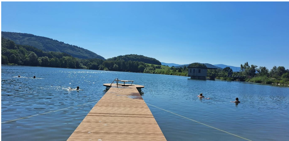
VN Větrkovice, Koprivnice – nově instalované molo, okres Nový Jičín, Foto: KHS

Pravidelné sledování kvality vody ke koupání v přírodě v 33. kalendářním týdnu prováděli zaměstnanci Krajské hygienické stanice Moravskoslezského kraje v okresech Nový Jičín (nádrže Větrkovice, Kacabaja, Čerták a Údolí mladých) a Frýdek-Místek (tři místa Žermanické přehrady, dvě místa na přehradě Olešná a nádrž Brušperk).