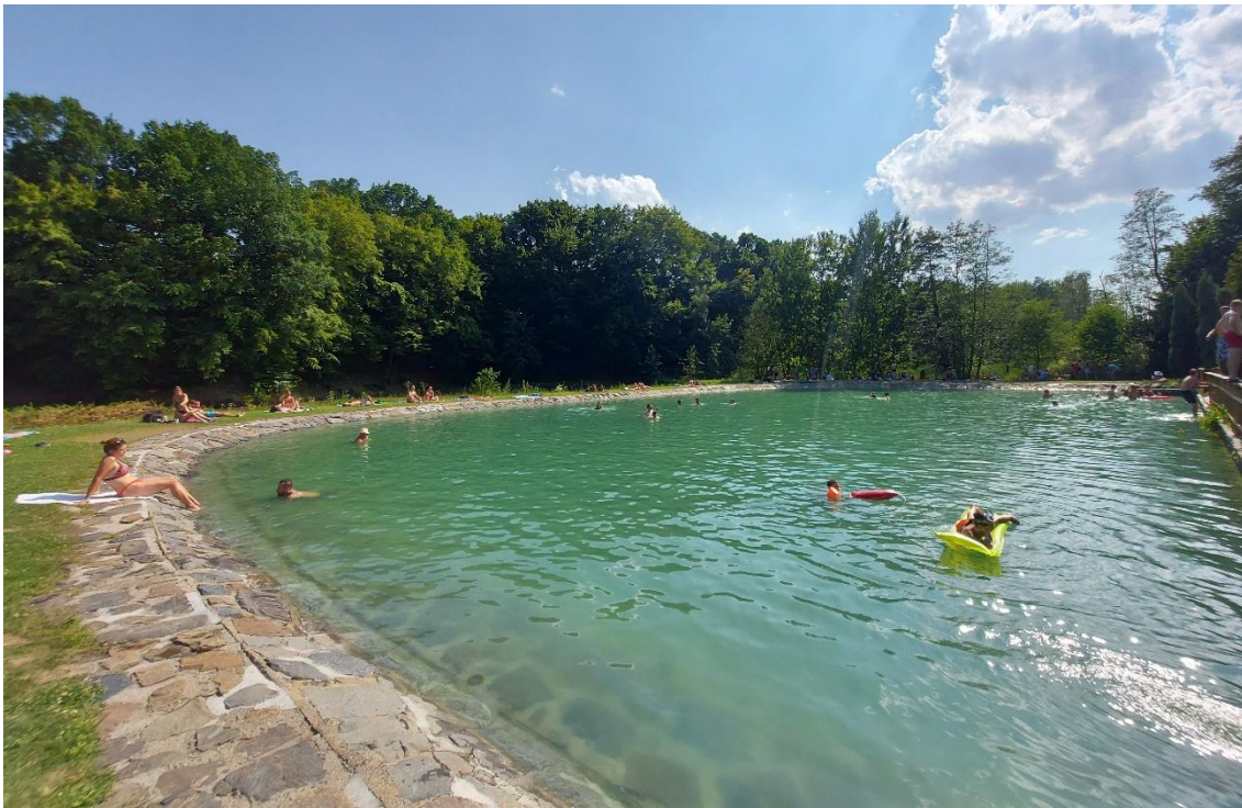
Areál koupaliště Na Hrázi Darkovice, okres Opava, Foto: KHS

Zaměstnanci KHS MSK rovněž pokračovali v kontrolách přírodních koupališť. K dispozici jsou vyhovující výsledky kvality vody z nádrží v areálu Heipark – Tošovice, koupališti Na Hrázi Darkovice, Ondrášův dvůr – Bílá, ve velké nádrži Wellness Hotelu Bahenec, v nádrži u horského hotelu Lorkova vila a v přírodním koupacím biotopu u penzionu Jurášek v Kunčicích pod Ondřejníkem.