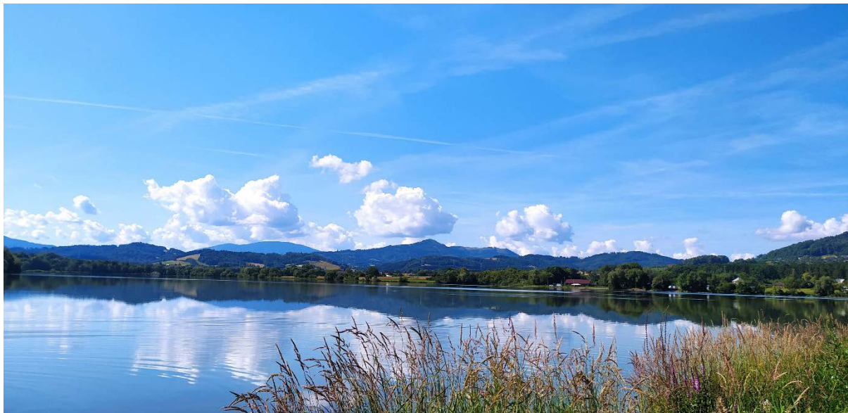
VN Olešná, okres Frýdek - Místek

Ve vodních nádržích Olešná a Brušperk je snížena průhlednost vody a v důsledku toho je kvalita vody hodnocena jako voda vhodná ke koupání se zhoršenými vlastnostmi. Voda v ostatních uvedených vodních plochách ve volné přírodě je vhodná ke koupání. Průběžně dochází také k jejímu prohřátí a teplota vody již překračuje příjemných 20 °C.