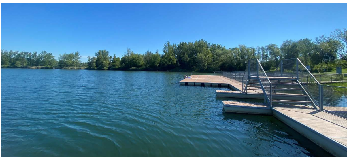
Vrbické jezero, okres Karviná, Foto: KHS

Začátkem tohoto týdne zajistila laboratoř Zdravotního ústavu se sídlem v Ostravě ve Vrbickém jezeře a vodních nádržích Těrlická přehrada a Brušperk sběr vodních plžů ke stanovení původců cercárie dermatitidy. V žádném z odebraných vzorků nebyly nalezeny cercárie schopné způsobit u lidí toto onemocnění. S ohledem na potvrzený výskyt plžů vylučujících cercárie při odběru před zahájením letošní koupací sezóny ve Vrbickém jezeře a v Těrlické přehradě – Pacalůvka, však riziko onemocnění cercárie dermatitidou v souvislosti s koupáním nelze vyloučit a nadále je zde voda hodnocena jako zhoršená jakost s mírně zvýšenou pravděpodobností vzniku zdravotních problémů při vodní rekreaci.