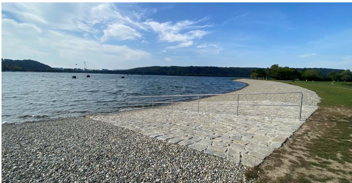
Štěrkovna Hlučín, okres Opava

Dle monitorovacího kalendáře zajistil odběr vzorků vody ke kontrole provozovatel sportovně rekreačního areálu štěrkovny Hlučín a Karvinského moře. Výsledky provedených laboratorních rozborů prokázaly vyhovující jakost vody.