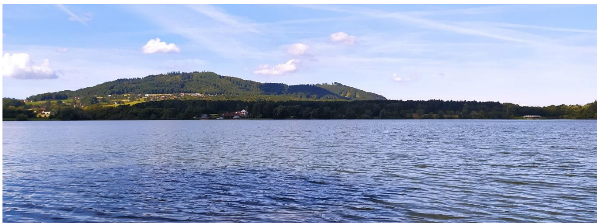
Vodní nádrž Olešná, okres Frýdek - Místek

Laboratorní analýzy potvrdily masivní rozvoj toxických sinic ve vodní nádrži Olešná. Z uvedeného důvodu je voda v této nádrži nebezpečná ke koupání a dne 7.8.2024 byl ze strany KHS MSK vydán veřejnou vyhláškou, opatřením obecné povahy, dočasný zákaz používání povrchové vody ke koupání na dvou koupacích místech VN Olešná - Místek a Palkovice. Tento zákaz platí do odvolání a v případě, že nebude odvolán, do konce koupací sezóny 2024. Sinice obsahují látky, které mohou způsobovat alergické reakce. V závislosti na individuální citlivosti a době pobytu ve vodě se u koupajícího mohou vyskytovat různé projevy, např. kožní vyrážky, zarudlé oči, rýma. Některé druhy sinic mohou produkovat i jedovaté látky (toxiny), které mohou následně způsobit střevní a žaludeční potíže, bolesti hlavy, ale i vážnější jaterní problémy.