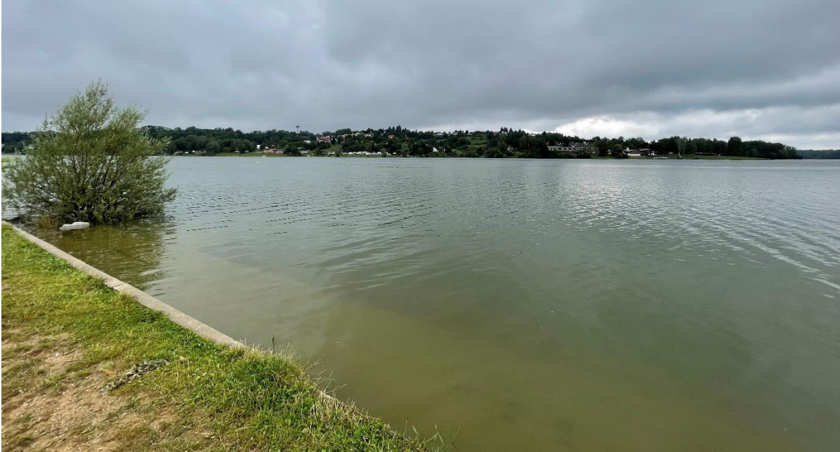
Vodní nádrž Žermanice, okres Frýdek - Místek

Zhoršenou jakost vody ke koupání vykazuje nádrž Žermanice, množství sinic a chlorofylu-a překročily hodnoty druhého stupně již na všech třech koupacích místech, a proto hodnotíme červeným symbolem - voda nevhodná ke koupání. Ve vodní nádrži Brušperk došlo k mírnému zlepšení z hlediska hodnocení množství sinic, nicméně riziko vzniku onemocnění nelze vyloučit. K ověření vývoje kvality vody budou v následujícím týdnu odebrány kontrolní vzorky. Změna hodnocení na oranžový symbol – zhoršená jakost vody také proběhla ve vodní nádrži Údolí mladých v Bílovci, z důvodu zvýšení množství sinic ve vodě.